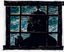
im Spritzenhaus sitzen