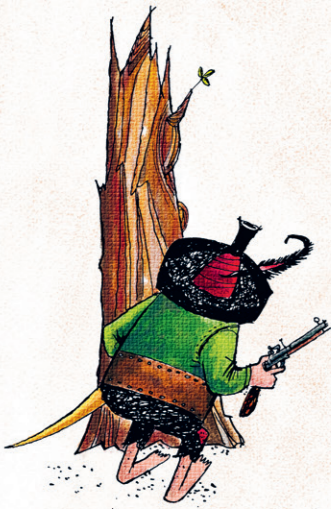
auf der Lauer liegen